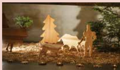
Un air de Gruyère s'invite à notre crèche.

Bienvenue à tous le vendredi 2 décembre 2016, 18h30-19h30