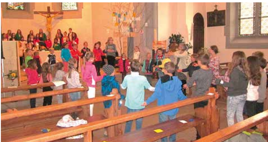
Collaborer avec le Petit Chœur a été aussi une belle expérience.

Pour plus de renseignements concernant le projet : http://www.missio.ch/fr/enfance/campagne-des-enfants/projets.html