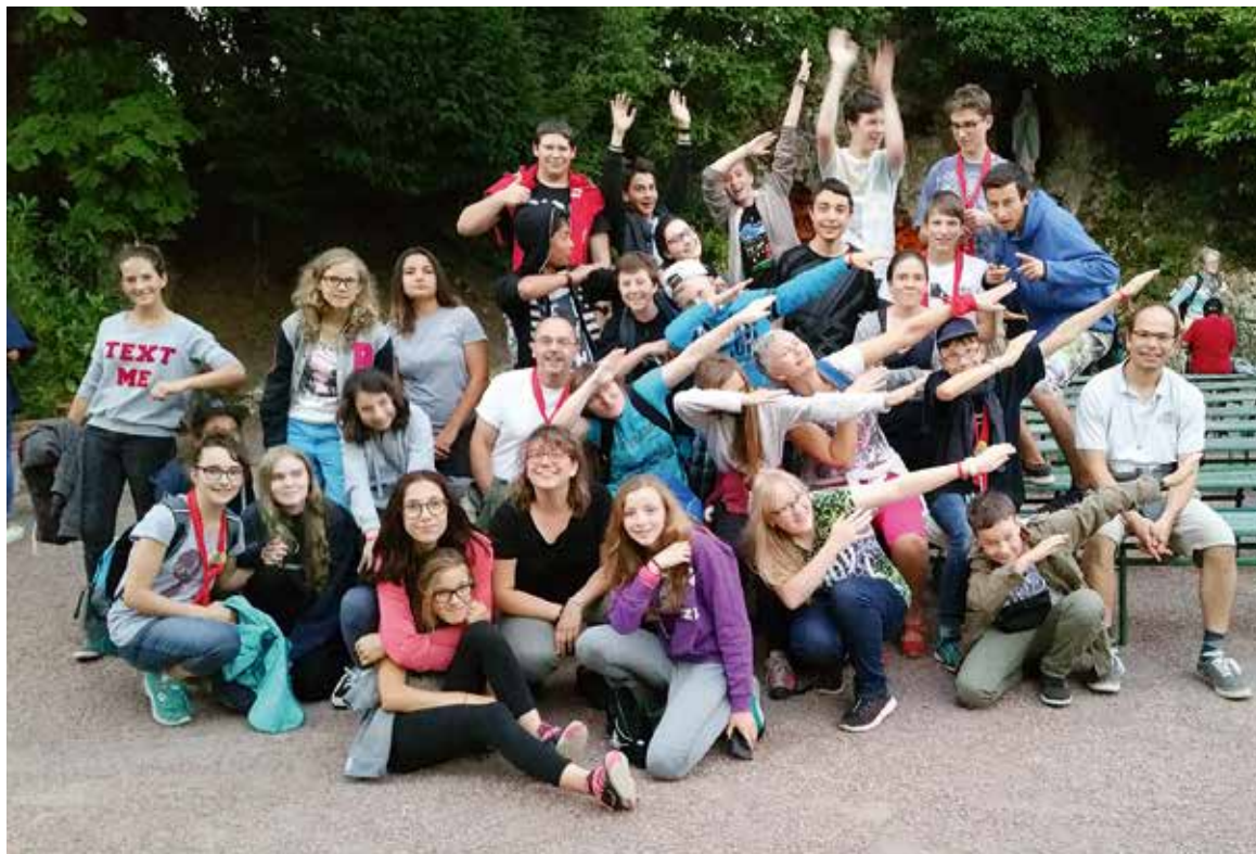
La joie des ados à Lourdes.

C'est avec des chants appris à Lourdes, des prières et des partages que les ados de Lourdes vous invitent à célébrer la Vierge Marie.