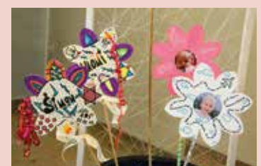
Les nouvelles pousses des baptisés fleurissent notre église.

Comme chaque année, nous invitons toutes les familles des enfants baptisés dans l'année à se retrouver lors de la fête du baptême du Christ . Nous vous attendons pour une petite célébration suivie d'un goûter le samedi 14 janvier 2017 à Farvagny à 15h, suivie de la messe à l'église à 17h pour ceux qui le souhaitent.