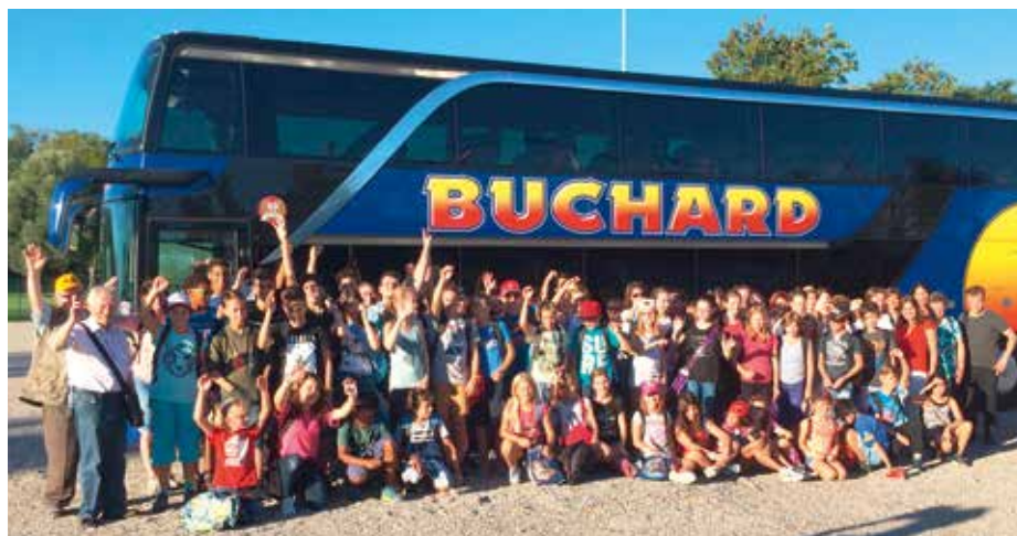
S'amuser ensemble crée des amitiés.

Cette journée était géniale et c'était super d'être avec tous les autres servants de l'UP! Journée pleine de joie, de soleil et de rires! Merci.