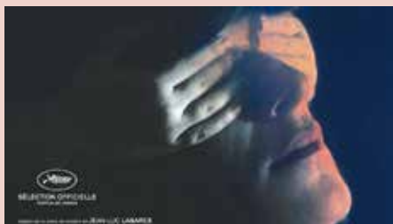
« Juste la fin du monde », de Xavier Dolan, a remporté le Prix du Jury œcuménique au Festival de Cannes 2016.