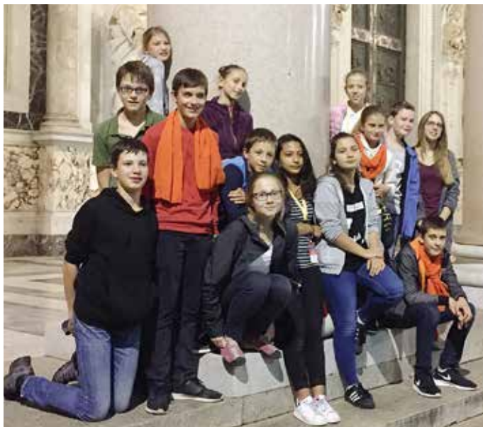
En voyageant ensemble, on vit des moments forts !

C'est très tôt le matin du samedi 22 octobre que les servants de messe de la paroisse de Rossens ont rejoint un groupe de confirmands de la paroisse de Sainte-Claire afin d'embarquer dans le car, direction : Rome !