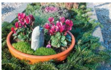
Décorer la tombe est un rite important du deuil.

Vivre un Noël sans la personne qui nous manque sera une étape importante. Afin de mieux la supporter, nous pouvons créer quelques rites qui permettront de mettre des mots et des gestes sur la peine qui nous habite.