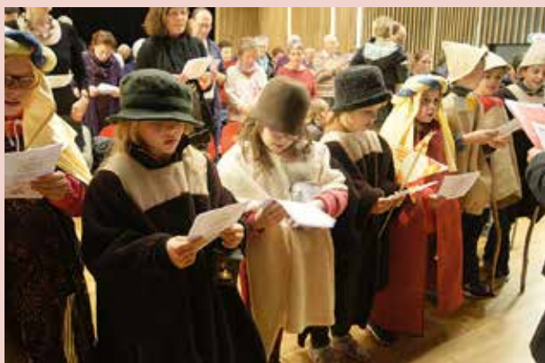
Nos petites bergères chantent à la messe de 2015.