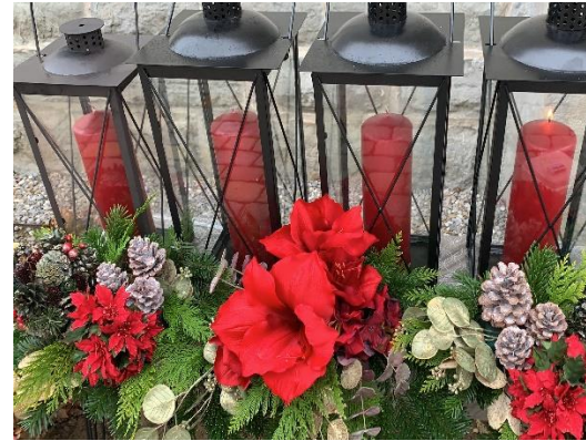
Couronne de l'Avent paroisse de Rossens