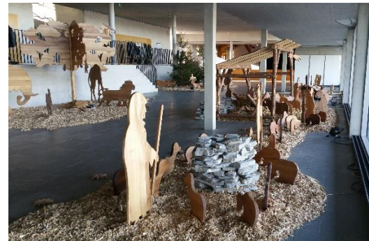
Crèche CO du Gibloux de Farvagny