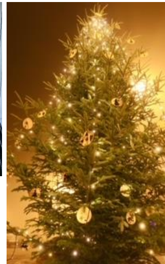
Sapin centre village Rossens