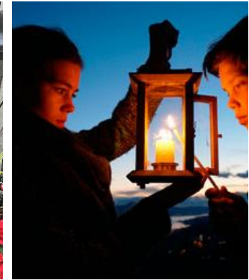
Lumière de Bethléhem